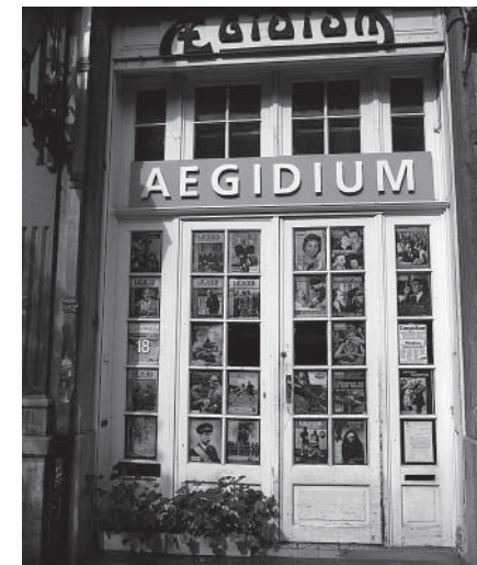
Een plek waar verschillende culturen elkaar ontmoeten

geen evidente zaak is. «Er zijn maar weinig andere nationaliteiten aanwezig.» «Zelf zou ik willen dat de anderen ook komen.» Volgens meerdere deelnemers zouden de bijeenkomsten meer kleur moeten hebben, want «het interculturele versterkt. Meer kleur brengt meer rijkdom.» De wil om zich tot meer culturen open te stellen, vertaalt zich ook in het belang van de intergenerationele dimensie, of dit nu binnen de discussiegroep is of tijdens de activiteiten. De groep verwelkomt zo af en toe de kinderen van de deelnemers.