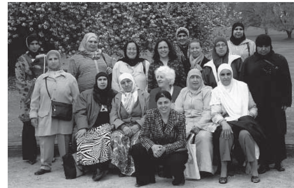
Samenkomen om onze behoeften in te vullen

D e vereniging Senioren Zonder Grenzen nodigt tweemaal per week een dertigtal vrouwen uit, hoofdzakelijk van Maghrebijnse afkomst. Zij nemen aan allerlei activiteiten deel: Franse les, naailes, culturele uitstapjes. Een keer per maand houden ze een discussiemoment over thema's die hen rechtstreeks aanbelangen, hen beroeren of de samenleving in haar geheel raken.