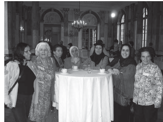
Verbonden buiten ons huis

«Het doet deugd om hier te zijn in plaats van thuis met mijn miserie en problemen.» «We komen buiten, vertellen en naaien.» Voor de meeste deelnemers is Senioren Zonder Grenzen een gelegenheid om «onze neus buiten te steken en mensen te ontmoeten.» Dit is een plek waar je je op je gemak voelt, waar je binnen- en buitenkomt wanneer je wilt. «Hier hebben we ons nog nooit vreemdeling gevoeld.» «Ik ben hier gekomen om te leren lezen en schrijven en dat doet deugd.»