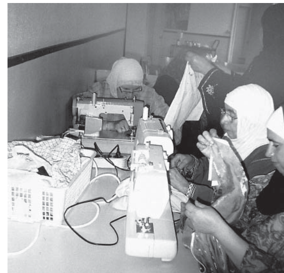
Ontdekken, leren en samen doen