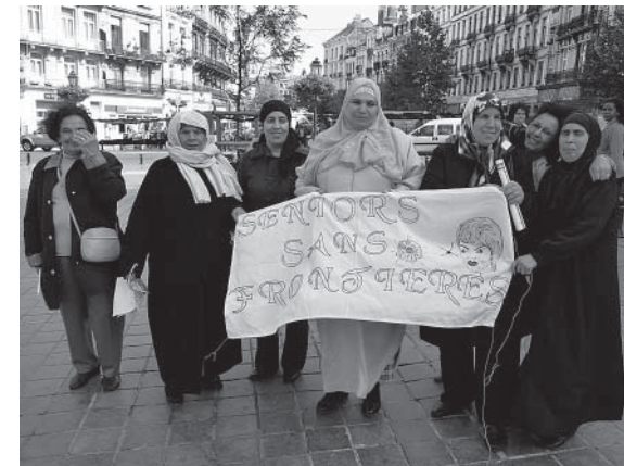
Krachten bundelen voor het recht op erkenning

A ls je de relatie met de buitenwereld aankaart, de openstelling van de groep of de link met de instellingen, dan komen de banden met het land van oorsprong als het ware spontaan tevoorschijn. Het gaat hier om een complexe relatie tussen twee nationaliteiten die sterk verankerd zijn en toch beide onvolledig zijn.