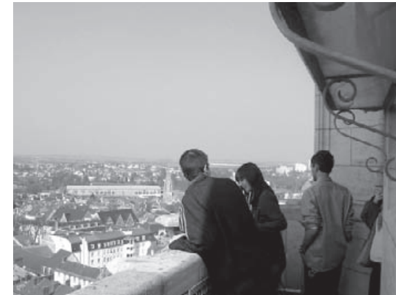
Visite du Beffroi

D'autre part des randonnées et des visites de sites naturels, de zones professionnelles et de centres de formation, des "safaris photo" sont prévus pendant la durée de l'action pour alimenter l'un ou l'autre de ces projets.