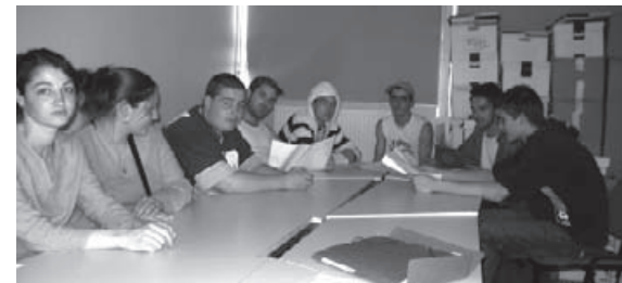
Au travail avec Capacitation