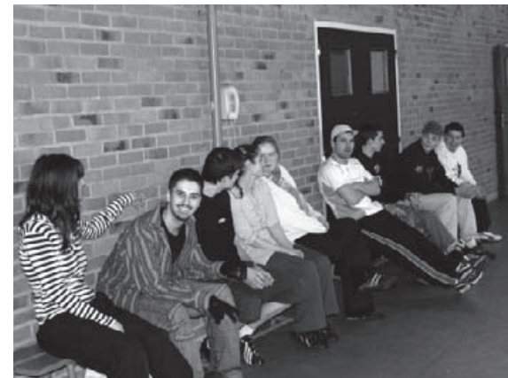
Le groupe à ses débuts dans la salle de sport

Il s'agit d'apprendre, en agissant dans une activité qui a du sens, en montant un projet collectif, une expérience concrète en coopération avec les autres membres du groupe et l'équipe pédagogique, pour mutualiser les compétences et savoir-faire.