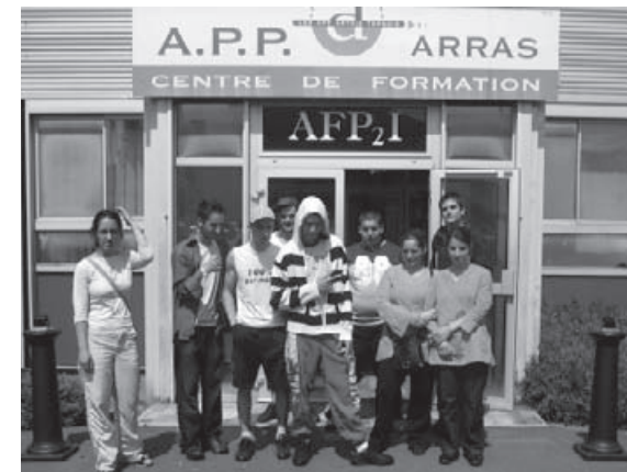
Le groupe à la dernière séance

Le groupe comporte dix jeunes, celui-ci est composé de 6 garçons et 4 filles. L'action se déroule du 29 janvier au 13 juillet, de 9h à 17h tous les jours, avec deux stages de 3 semaines en entreprise.