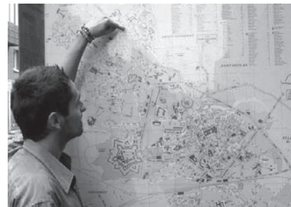
Le quartier Ouest sur le plan d'Arras

On verra si le projet Capacitation Citoyenne aide à présenter plus facilement les réalisations, notamment grâce aux photos.