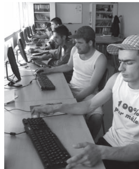
Dans la salle Eiffel

centre de ressources des Quartiers Ouest. Il faudra « qu'il accroche l'œil, on a déjà pensé à le faire en format calendrier, avec la marge en haut. » Au bout de deux mois, un gros classeur est déjà plein, organisé par thèmes, et en mai la maquette a été transformée. Elle prendra plutôt la forme de plan les différentes zones géographiques de Arras (Est, Ouest, Nord, Sud) repérant les lieux avec une photo de chaque établissement. La plaquette se nommera le "GPS 2 l'INFO".