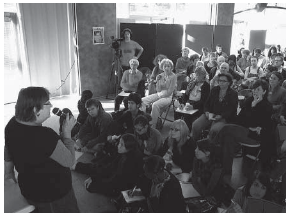
La présidente d'Equitess présente Festisolis.

Equitess a financé et organisé, pour sept personnes du collectif, un voyage de 3 jours à Barcelone pour des rencontres universitaires, pour apprendre, trouver de nouvelles idées, visiter des sites. Si les présentations théoriques n'étaient pas toujours faciles à suivre, les visites étaient très intéressantes (stylistes qui avaient réussi à faire sortir des femmes de prison dans la journée, pour travailler et se faire un petit pécule). Lorsque les subventions n'arrivent pas, forcément on se dit qu'on n'est peut-être pas dans le bon timing. « Mais, quand on entend des chercheurs prouver que l'hybridation social/marchand marche, ça reconforte. »