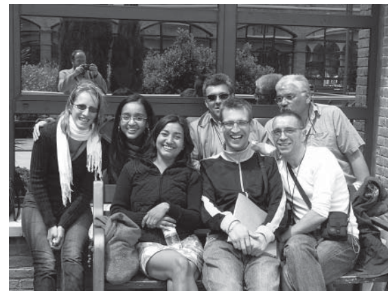
Voyage à Barcelone.

Equitess a financé et organisé, pour sept personnes du collectif, un voyage de 3 jours à Barcelone pour des rencontres universitaires, pour apprendre, trouver de nouvelles idées, visiter des sites. Si les présentations théoriques n'étaient pas toujours faciles à suivre, les visites étaient très intéressantes (stylistes qui avaient réussi à faire sortir des femmes de prison dans la journée, pour travailler et se faire un petit pécule). Lorsque les subventions n'arrivent pas, forcément on se dit qu'on n'est peut-être pas dans le bon timing. « Mais, quand on entend des chercheurs prouver que l'hybridation social/marchand marche, ça reconforte. »