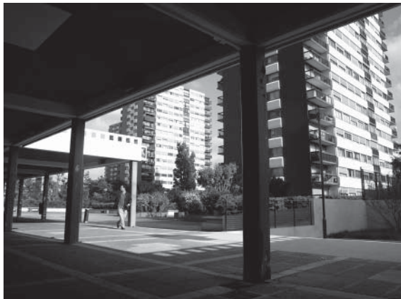
Vue de l'intérieur du centre commercial des Larris.