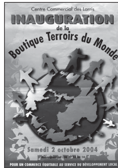
Affiche de Terroirs du Monde pour un commerce équitable au service du développement local.

Pour que Terroirs du Monde vive, il fallait rendre le centre attractif, construire un projet global qui présenterait une solution réaliste et viable pour l'ensemble du centre commercial, se regrouper pour devenir plus forts.