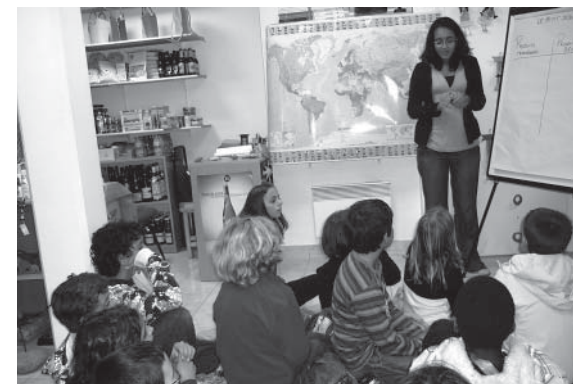
Ateliers scolaires de Terroirs du Monde.

« Va raconter ça à quelqu'un qui n'en a jamais entendu parler! »