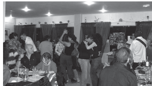
Soirée dansante organisée par Nuevo Concepto Latino.

« C'est important de pouvoir se répartir les rôles. Ça montre que dans le monde associatif on peut être militant et professionnel. »