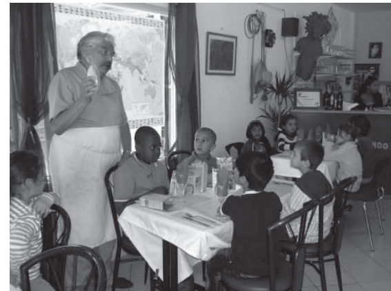
Après-midi dégustation pour les enfants.

Il y a aussi de bonnes relations avec "Larris au cœur" (ancien centre social), dont les bénévoles ont repris les locaux et dont la présidente fait partie d'Equitess. Il y a le public et le lieu. Certains membres d'Equitess font partie d'autres collectifs, comme celui qui organise la fête de la musique.