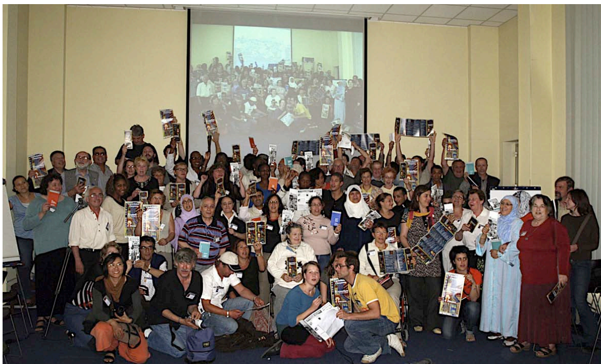
Présentation Karavane dans l'agglomération grenobloise

Toutes les informations sur le réseau Capacitation Citoyenne sont disponibles sur le site www.capacitation-citoyenne.org