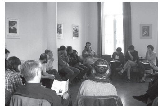
« Parlons-en » en action, déroulement habituel d'une réunion

Cette possibilité de s'exprimer, offerte aux utilisateurs, n'est bénéfique que dans la mesure où ceux-ci se sentent écoutés, par leurs pairs mais également par les personnes responsables de services. Cette déontologie , mise en avant pour présenter « Parlons-en » oriente de manière générale la conception de l'action sociale qui prévaut au sein du Relais social. Dignité, solidarité, citoyenneté , sont autant de principes, de guides pour le travail des agents des services coordonnés par le Relais.