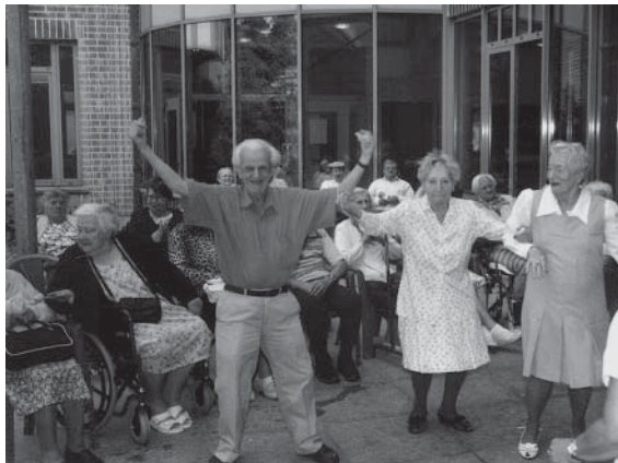
De kleuren en het dynamisme zijn aanwezig

«Ik ben hier niet gelukkig. Ik bid elke dag want ik ben bang dat ik aan mezelf zal overgeleverd worden. Angstig door het leven gaan, is geen leven!» Deze woorden zorgen voor verschillende reacties bij de andere bewoners, die relativeren, moed inspreken en over hun eigen situatie vertellen.