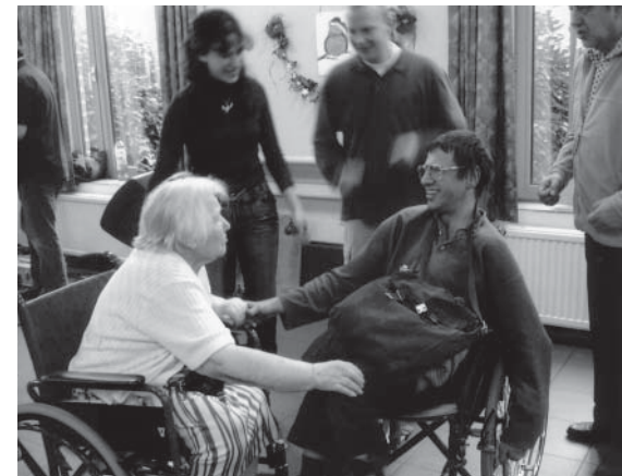
Een dansfeest trekt volk aan in rusthuis De Latour

uitstraling te geven.» Plekken die de ruimte 'opengooien' en waar ook bezoekers zich goed voelen. « We zouden de hal kunnen verplaatsen naar de plek waar de cafetaria zich nu bevindt en omgekeerd.» Zo wordt de inkomhal een stuk gezelliger en is er een verbinding met de tuin.