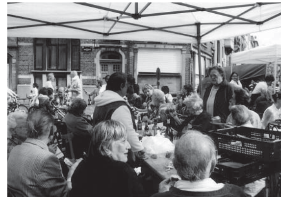
We willen de banden met de wijk aanhalen

« D e mensen van het OCMW (openbaar centrum voor maatschappelijk welzijn) zien we op een inhuldiging of een feest in het rusthuis», maar het gebeurt zelden dat ze langskomen om de bewoners te ontmoeten en naar hen te luisteren. Het zijn altijd de personeelsleden die de schakel vormen en die uitleggen wat er zo allemaal in het rusthuis gebeurt.