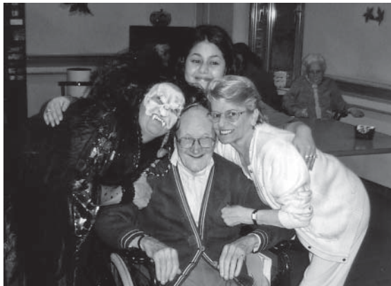
Gedeelde vreugde naar meer solidariteit

H et delen van de kamers is een gevoelig onderwerp dat vaak in de gesprekken terugkomt.