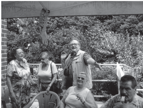
Een familielid speelt piano voor de andere bewoners

« A ls het de bewoners zelf zijn die hun mening zeggen, dan zal dit ook een impact hebben op verdere acties.» De bewonersraad speelt immers een belangrijke rol bij de hulpverleners en de directrice, die zich sterker ondersteund voelen in bijvoorbeeld de gemeentelijke seniorenraad. Zij fungeren dus als spreekbuis voor de bewoners en kunnen dan ook hun vragen en bekommernissen overbrengen.