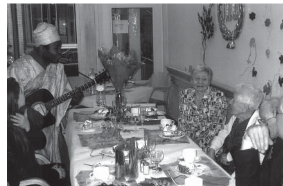
Een honderdjarige verjaart: dat wordt gevierd

Bepaalde medewerkers, die zich bewust waren van het belang van deze ruimte, hebben ook een belangrijke rol gespeeld. Tot grote opluchting van de bewoners ging enkele maanden later de cafetaria weer open en werd er extra personeel ingezet voor de werking en de animatie.