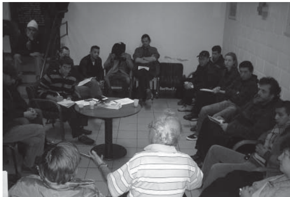
Vergadering van de Spreekruimte bij Article 23

« T heatervoorstellingen, die zijn gemakkelijk te organiseren, maar de Spreekruimtes, dat is heel wat anders! Nochtans is het een kans om banden te scheppen, om dichterbij elkaar te komen. Dikwijls vertrekken we vanuit de situatie van een bepaalde persoon.»